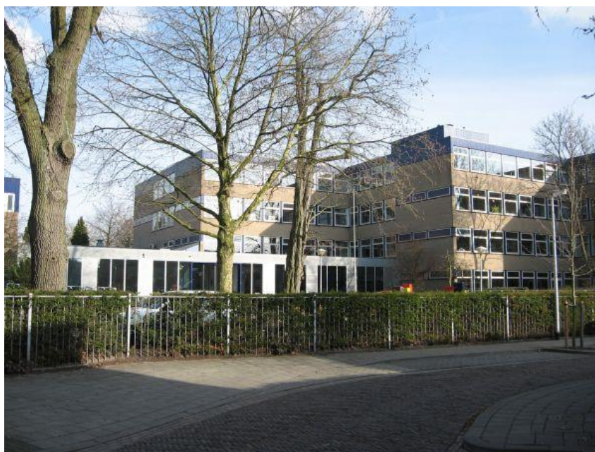
Goois Lyceum (VO; GSF), Bussum